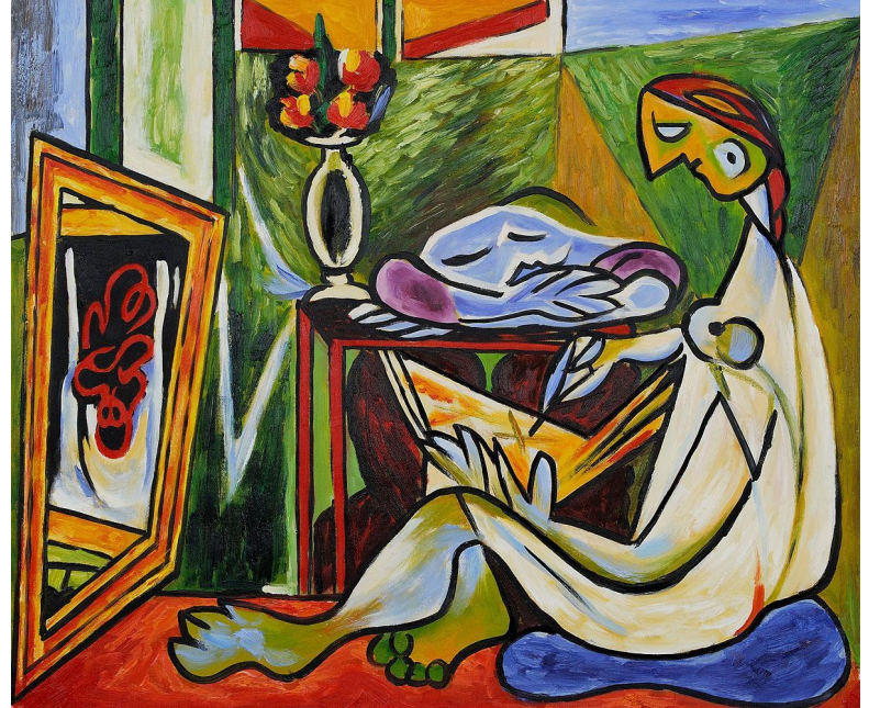
Bild 2 von Pablo Picasso